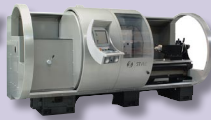
licht constructiewerk, raamwerk en covering voor machinefabrikant