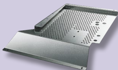
fijnmechanische plaatwerk producten